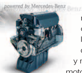
powered by Mercedes-Benz

El Gazelle de Ponsse sigue los pasos de su hermano mayor, Wisent,